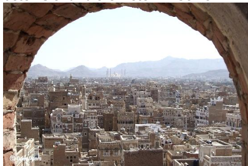
Sanaa, Jemen. Nachricht von Open Doors.

Mindestens 95 Prozent der Christen im Jemen sind christliche Konvertiten muslimischer Herkunft. Treffen sind nur heimlich möglich, doch viele Untergrundkirchen mussten ihre Treffen einstellen. Neben den Behörden droht den Christen bei Entdeckung ihres Glaubens Verfolgung durch ihre Familie bzw. ihren Clan. Bitte beten Sie für die Christen im Jemen!